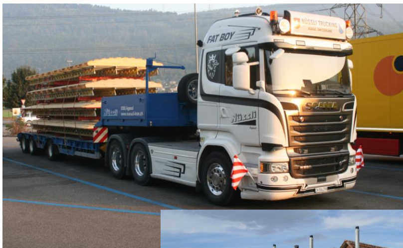
Transport der Pritschen mit Tieflader oder LKW